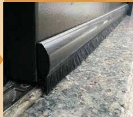
「ドアドアムシヘル」を取り付けることにより、虫や“ホコリ”の侵入を防ぎます。